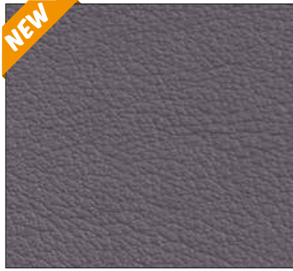
WK - GRIGIO GREY