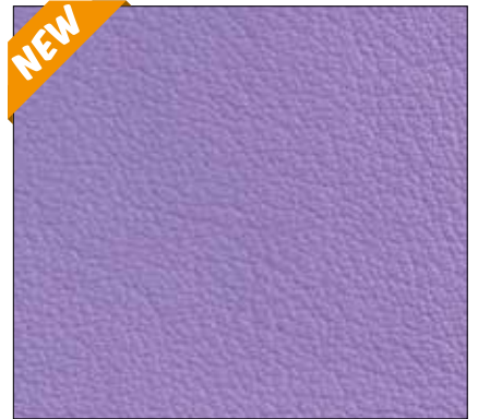
WQ - LILLA' LILAC