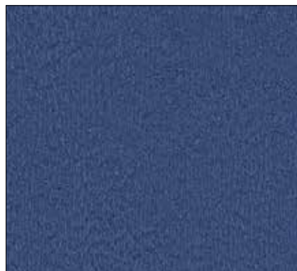
W2 - BLU CHIARO LIGHT BLUE