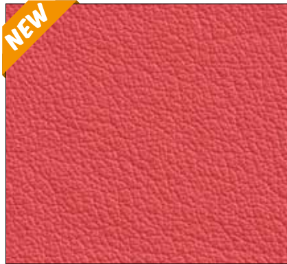
WG - CORALLO CORAL