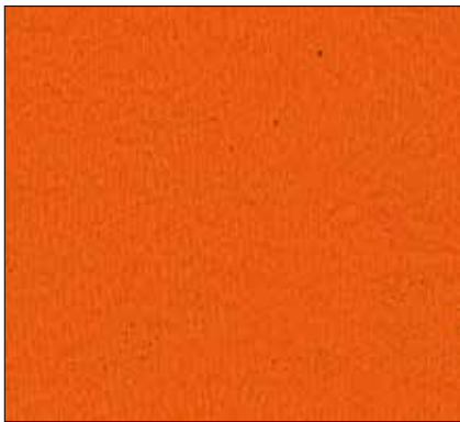
WZ - ARANCIONE ORANGE