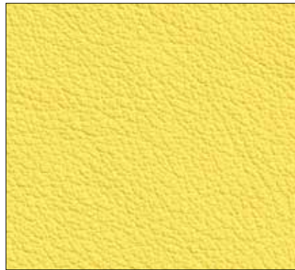
W4 - GIALLO YELLOW