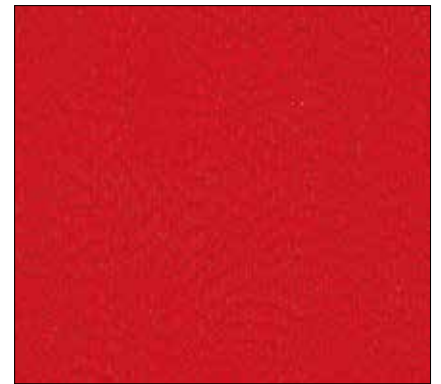
WF - ROSSO RED