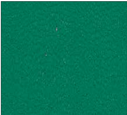
W1 - VERDE SCURO DARK GREEN