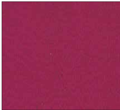
W9 - FUCSIA FUCHSIA