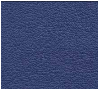
WL - BLU SCURO DARK BLUE