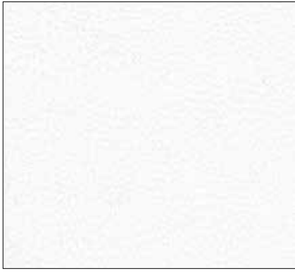
WA - BIANCO WHITE