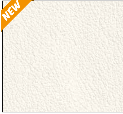
WN - AVORIO IVORY