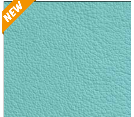
WE - ACQUAMARINA AQUAMARINE