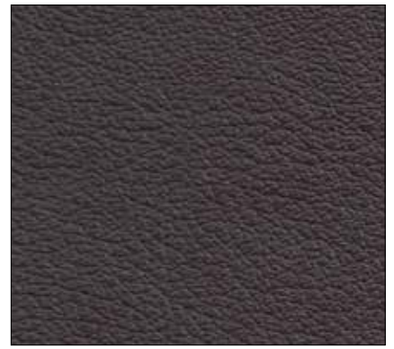
WS - MARRONE SCURO DARK BROWN