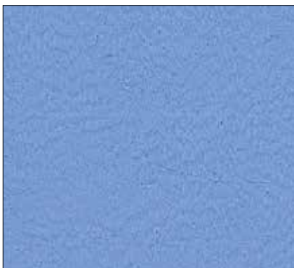
WR - AZZURRO FIORDALISO LIGHT CORNFLOWER BLUE