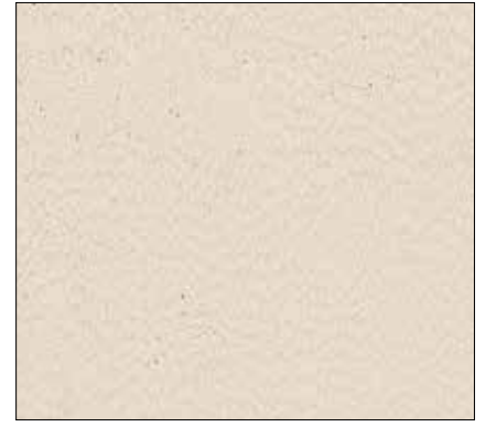
W8 - BEIGE BEIGE