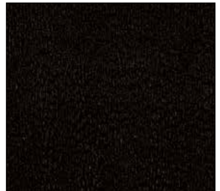
WP - NERO BLACK

IMPORTANTE: In caso di ordine per cortesia ricordarsi di specificare il codice del colore di tappezzeria insieme al codice del prodotto