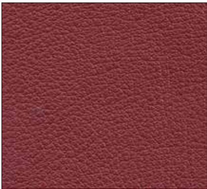
WH - BORDEAUX BURGUNDY