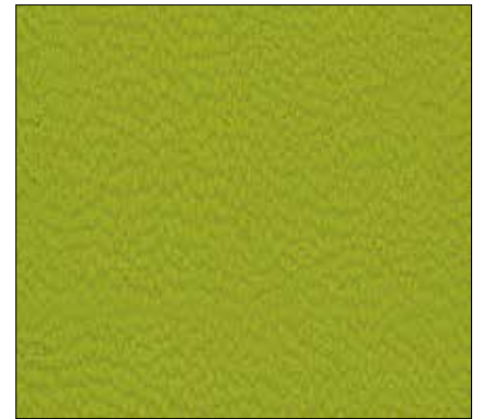
WT - VERDE LIMONE GREEN LEMON