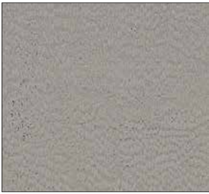
WZ - GRIGIO CENERE ASHGREY