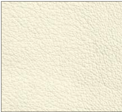
WB - CREMA CREAM